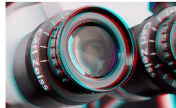
ตัวอย่างรูป 3 มิติ (มองห่างประมาณ 1 เมตร)